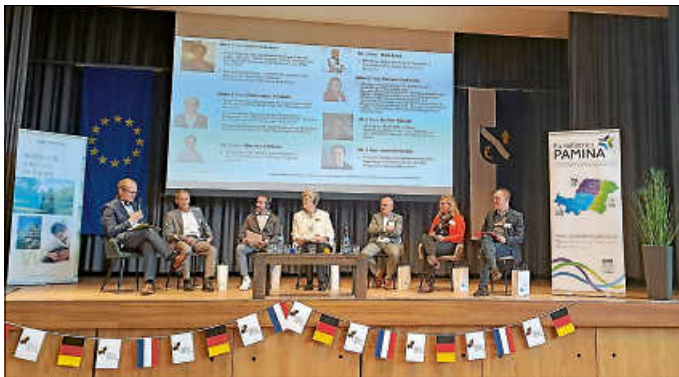
Die Podiumsdiskussion zeigt innovative Lösungen und inspiriert zu mehr Zusammenarbeit.