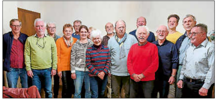
Erfolgreiche Teilnehmerinnen und Teilnehmer der Sportgruppe, die ihr Sportabzeichen in Gold, Silber oder Bronze erhalten haben.

Wie es der Name schon sagt, ist jedermann/jedefrau eingeladen und willkommen, sich dieser Gruppe anzuschließen. Es handelt sich um einen formlosen Zusammenschluss ohne Statuten und