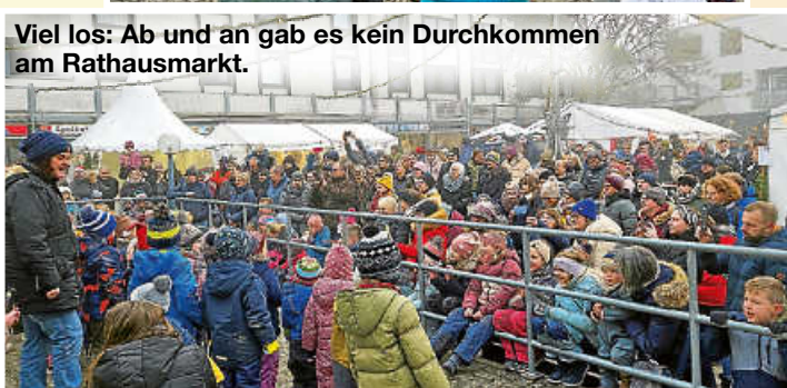
Viel los: Ab und an gab es kein Durchkommen am Rathausmarkt.