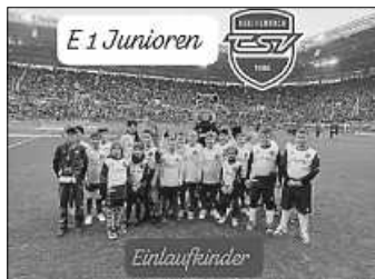
Einlaufkinder des TSV beim KSC

13.30 Uhr 1. A 2 - Junioren - Hallenspieltag in Durlach