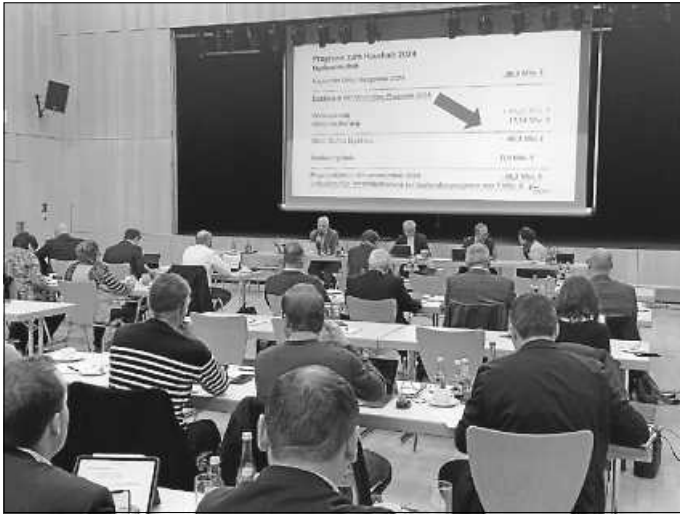
Die letzte Bürgermeisterkreisversammlung fand am vergangenen Mittwoch in Oberhausen-Rheinhausen statt.