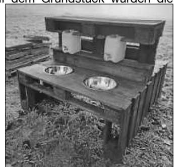
Die maßangefertigte Matschküche der Wiesenkinder

Neben diesen Fortschritten auf dem Grundstück wurden die Eltern der Wiesenkinder in gemütlicher Adventsstimmung bei Plätzchen und herzhaftem, warmem Zupfbrot über unser Konzept und die Eingewöhnung informiert. Alle offenen Fragen konnten im Anschluss im Gespräch mit dem gesamten Team geklärt werden. Besonders schön war zu sehen, wie die Eltern direkt das Konzept „Kindergarten in Elterninitiative“ verinnerlicht haben und viele tolle Ideen aufkamen, wie sie ihre Berufe und Hobbys proaktiv einbringen können. Mit so viel Engagement von allen Beteiligten steht der Eröffnung im Januar nichts mehr im Wege.