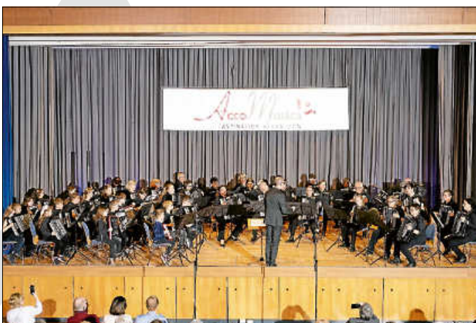
Musikalische Vielfalt beim großen Herbstkonzert von AccoMusica.

Vielfalt in jeder Hinsicht ist ein Kennzeichen von AccoMusica. Zum einen natürlich musikalische Vielfalt – wie beim jüngsten Herbstkonzert im gut besuchten Kurhaus in Waldbronn zu hören –, zum anderen aber auch hinsichtlich der bestehenden Orchester und Musiziergruppen.