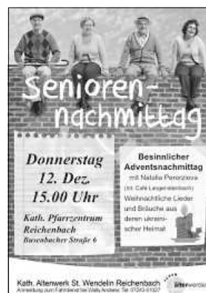
Plakat M. Bartberger